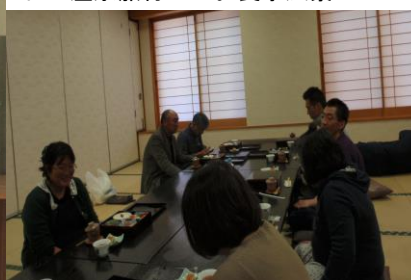
右：温泉旅行でのお食事風景

参加者は大満足でした。先日の病院祭では、精神科デイケアの紹介パネルを出展し、市民の方々にも私