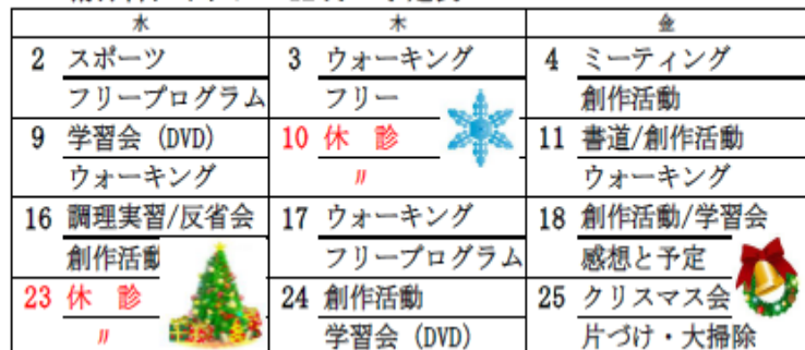
精神科デイケア 12月 予定表

※ 本誌に掲載している写真については、ご本人の了解を得ていることを付け加えます。