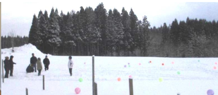
左：「鬼は外！」今年は鬼役の人が不在のため、盛り上がりは今ひとつでした。