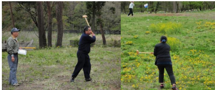
左上：大きく振りかぶって、フルスウィング。 右上：難コースをどう攻略するか。

北秋田市では田植えもほぼ終わり、田んぼを渡る風が心地よい季節になり、カエルがにぎやかに鳴き出しています。当デイケアでは5月の行事としてグラウンドゴルフ大会を開催しました。古参の利用者さんに聞くと、「旧米内沢病院以来、7~8年ぶり」とのことです。病院敷地内でプレーしましたが、