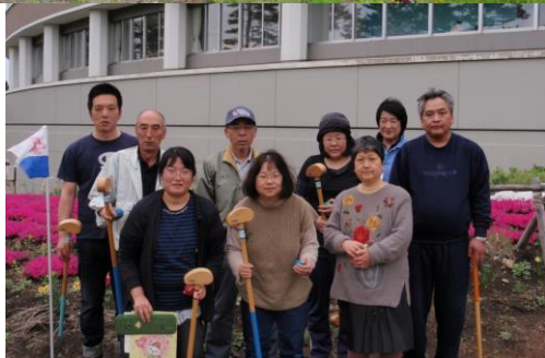
右下：健闘とフェアプレーを誓い、スタート前に記念撮影。

地面のでこぼこや雑草の塊に手を焼く方がいる一方、思わぬパワーヒッターもいて新たな一面を発見できました。多くの利用者さんにとっては、手軽に運動できるうえ景品まで獲得し、大満足の様子でした。