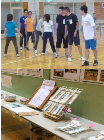
上：チームに別れて作戦会議。

病院の窓から見える風景がぐっと秋らしくなってきました。空や雲の様子が変わり、稲刈りがあちこちの田んぼで始まっています。台風ニュースも頻繁に聞こえるようになり、被害にあわれた方には謹んでお見舞い申し上げます。