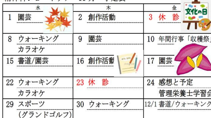
精神科ショートケア 11月 予定表

※ 本誌に掲載している写真については、ご本人の了解を得ていることを付け加えます。